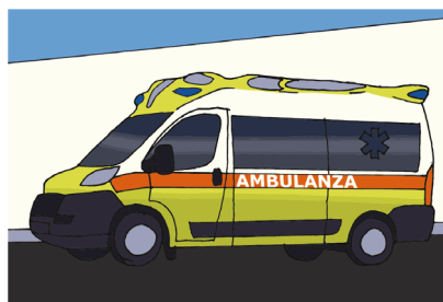
Fig.8 - Andiamo in ambulanza al Pronto Soccorso