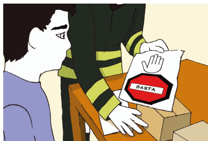
Fig.5 - Interrompi quello che stai facendo