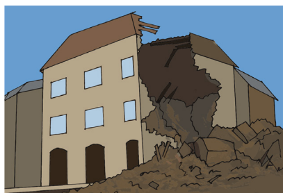
Fig.3 - C'è stato un terremoto