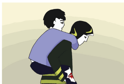
Fig.7 - Ti devo trasportare