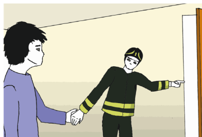
Fig.6 - Seguimi, andiamo fuori