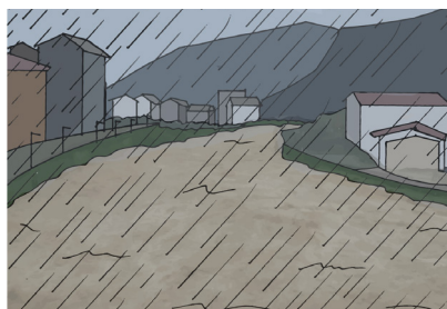
Fig.4 - Si sta verificando una alluvione